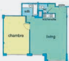
APPARTEMENT 1 CHAMBRE de 70 à 100 m 2 sans terrasse, mais avec "bow window"