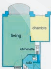
APPARTEMENT 1 CHAMBRE de 40 à 60 m 2 avec terrasse, côté parc